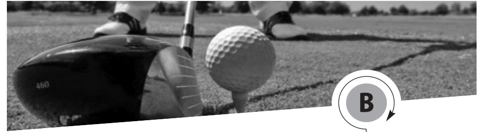
Tabla de equivalencias